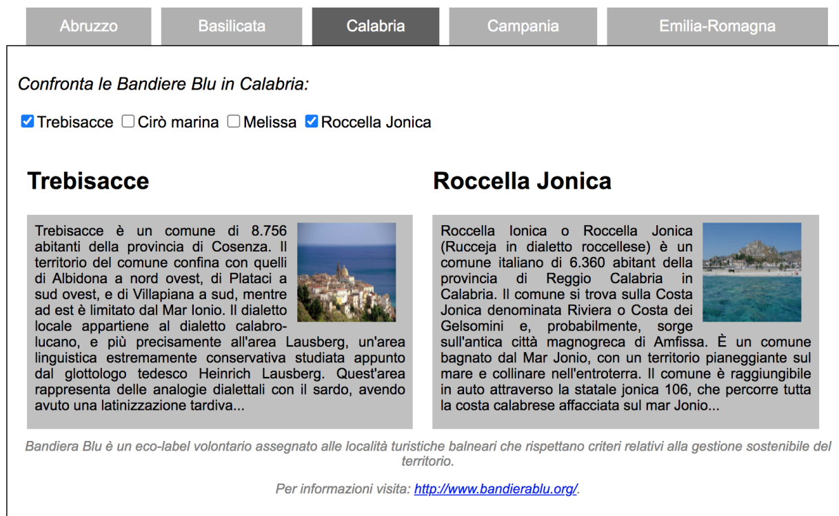
Figura 1 - Resa della pagina in un browser:

Immagini disponibili su: http://diiorio.nws.cs.unibo.it/twe/resources/1801/